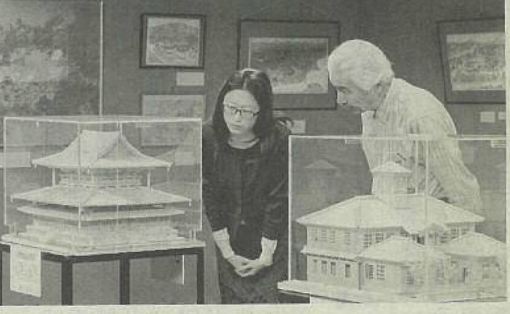
楊枝で作られた建物模型と、鳥瞰図が並ぶ会場 —近江八幡市多賀町の市立かわらミュージアムで

依存しない社 に進めるため、 るに見込んでおり、東日本 の策定を目指す 大震災前の原発の発電比率 案では30年度 87%にはほぼ相当する。太陽 費用を14年度 光発電(非住宅)とバイオ 燃料(時)比 マス発電の導入が振興戦略 、100.5 プラン策定時より速いベ と設定。発 スで進んでいるため、目標